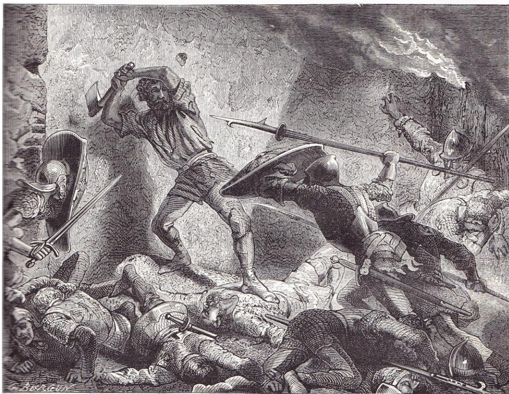
Le grand Ferré.

Poitou, de la Saintonge, du Rochellois, de l'Angoumois, du Limousin, de Montreuil-sur-Mer, de Calais et de Guines, et la restitution du Ponthieu.