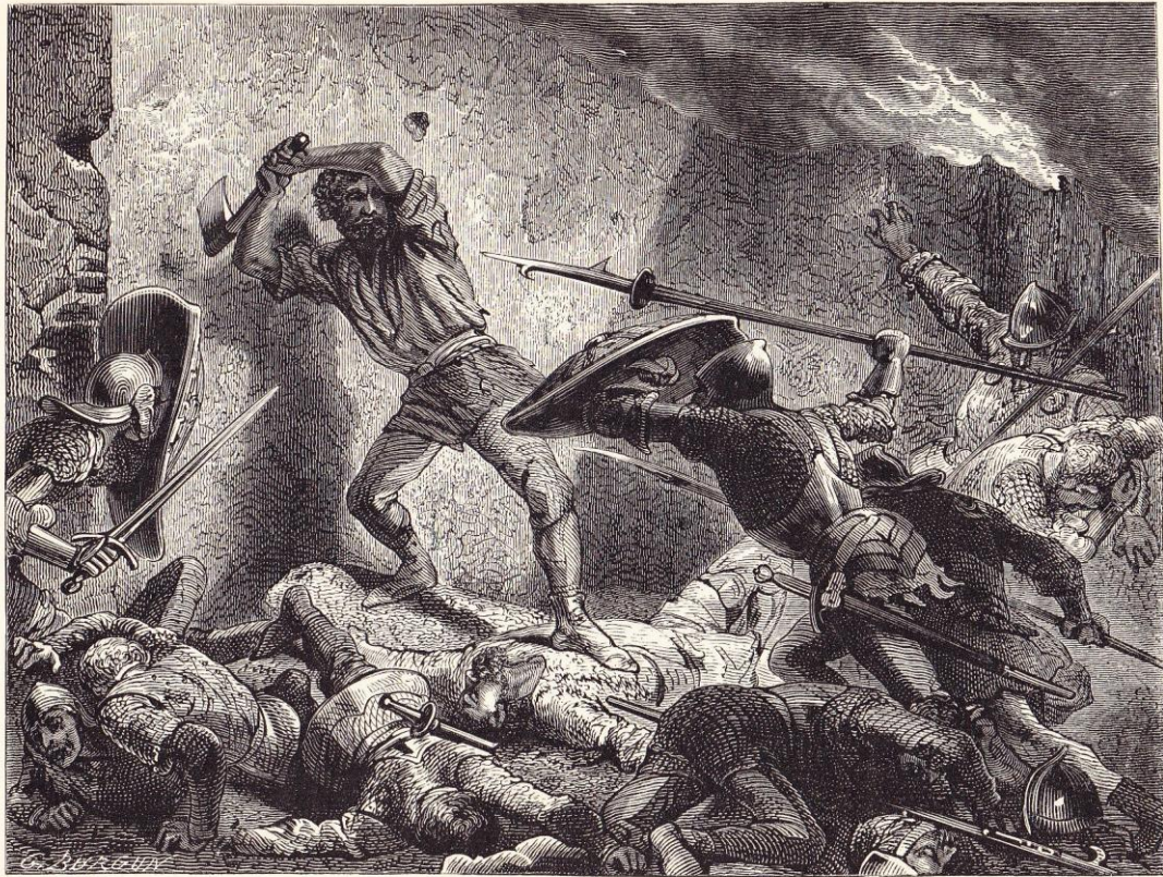
Le Grand Ferré.

Parue précédemment au moins, à la page 393, dans Henri MARTIN , Histoire de France populaire depuis les temps les plus reculés jusqu'à nos jours (Paris, librairie Furne – Jouvett et Cie éditeurs, tome premier (1867 ?, VII-588 pages):